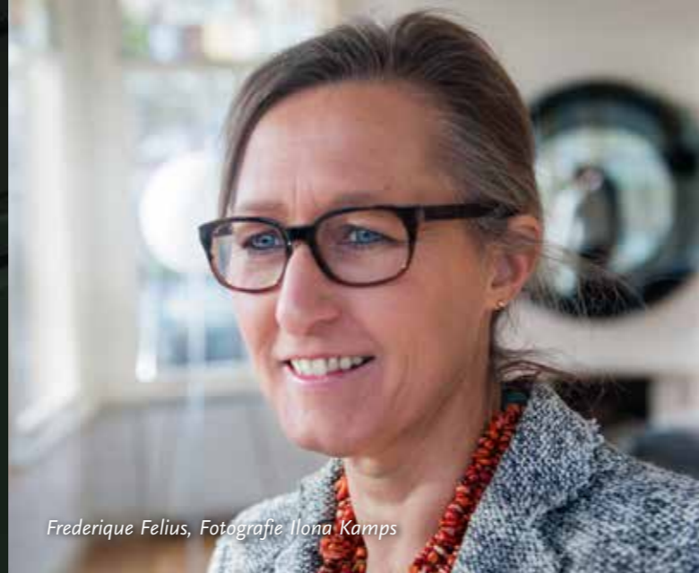
Frederique Felius