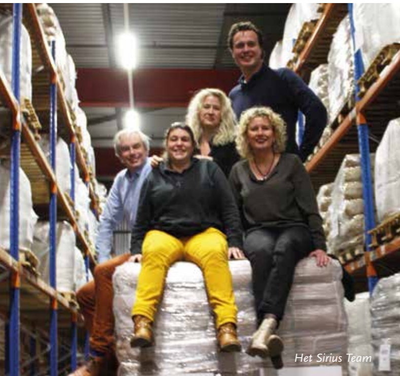
Het Sirius Team

Het gaat er immers om dat alle leden kiezen voor die verantwoorde zorg. Dit zou ik duidelijk adverteren. Het VHCP zou kunnen aanbieden om een nieuw lid aan de hand te nemen, zodat zo'n bedrijf binnen een paar maanden voldoet aan RC. Uiteraard moet iedere ondernemer zelf invulling geven aan het programma, maar dit kan wel werken om potentiële leden over de drempel te trekken. Daarnaast kan worden gewerkt aan een script voor de verplichte audit, zoals welke stappen waarvoor gelden. Zo kan het VHCP extra meerwaarde bieden bij de invulling van RC. Los van onze inspanningen voor RC speelt voor Sirius uiteraard ook REACH richting de laatste registratieronde in 2018. Als distributeur zijn we grotendeels afhankelijk van wat onze principals willen. Soms schuift Sirius aan bij het VHCP REACH Platform en tot nu toe hebben we twee casus ingediend, waarop goed is gereageerd. Wat mij in dit REACH-traject opvalt, is dat de markt van consultants stevig rekt en weinig concurrentie kent wanneer er bijvoorbeeld een Veiligheidsinformatieblad opgesteld moet worden."